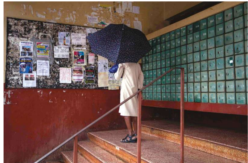
© Paul Hunter, Voyage Mirage , Le LaboPhoto, 2025.

Panajou → 18h Dunes , en présence de Claude Roussillon