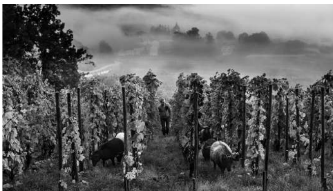
© Michel Joly, En première ligne - Vignerons et vigneronnes face au changement climatique.

→ Inauguration des expositions en présence des artistes, suivi d'échanges croisés avec Delphine Trentacosta et Michel Joly