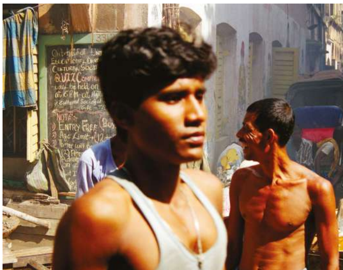
© Antoine Vincens de Tapol, Les paradis perdus .

→ Soirée projection Diapokés : des chansons à voir