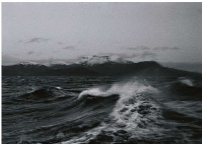
Anne-Lise Broyer, L'eau noire et le tableau © ADAGP, Paris, 2025.

L'eau noire est le tableau n'est pas une série, mais un voyage visuel entre plusieurs œuvres. Comme une phrase, il relie des images anciennes et inédites, des lieux, des lectures, des chansons et des époques. Ce projet interroge l'acte photographique, explorant la spécificité de l'image et son histoire. La photographie, longtemps en quête de son propre langage, dialogue ici avec le dessin, oscillant entre le regard et la main.