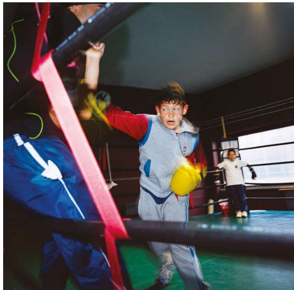
© Sergio Corona, Les Fils de Librino .

→ Conférence-débat La boxe, une école de la vie et de la citoyenneté