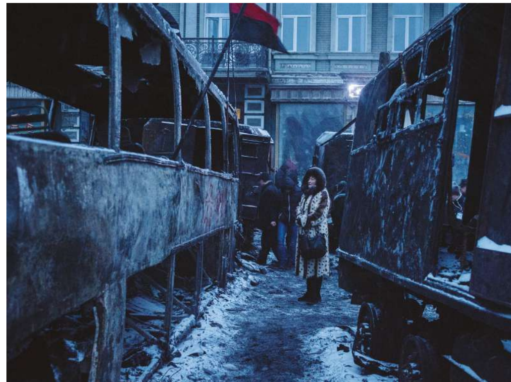
Ukraine, Terre désirée.

→ 10h Atelier série photographique. Infos et inscription à contact. cdanslaboite@gmail.com