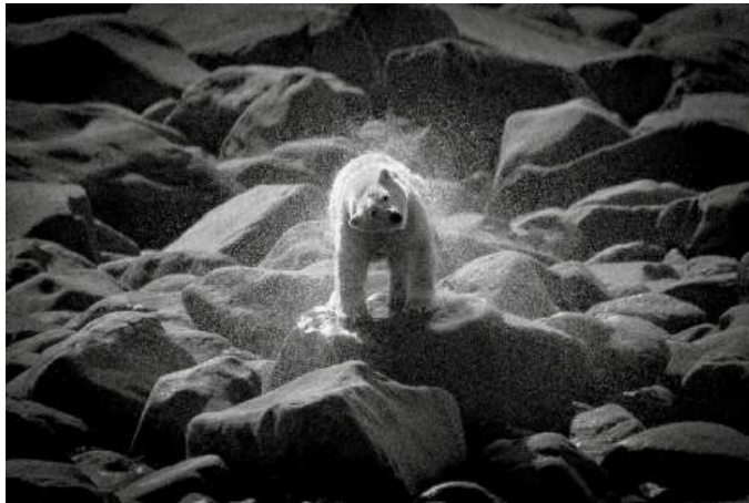
© Olivier Morin, Un grand bol d'Art Pur .

Durant le mois de la photo, une sélection d'images d'Olivier Morin, photographe pour l'AFP, illustre les effets du changement climatique dans le Grand Nord. Les photographies, en noir et blanc ou en couleurs, sont exclusives et témoignent des conséquences du réchauffement climatique.