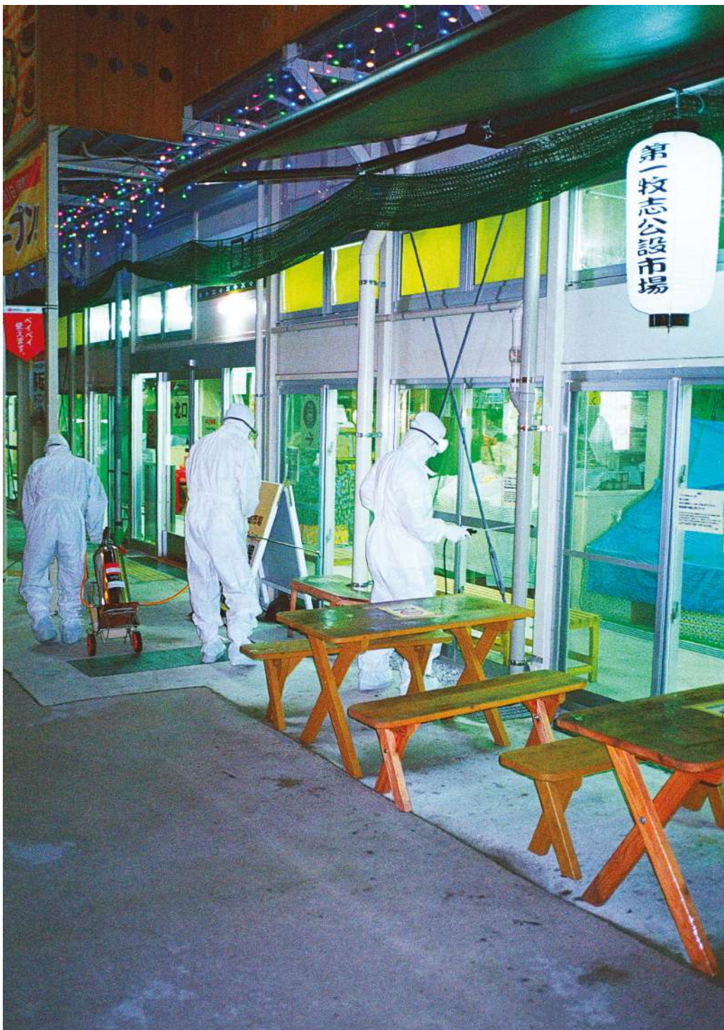
© Alexandre Morvan, Cherry Trees .