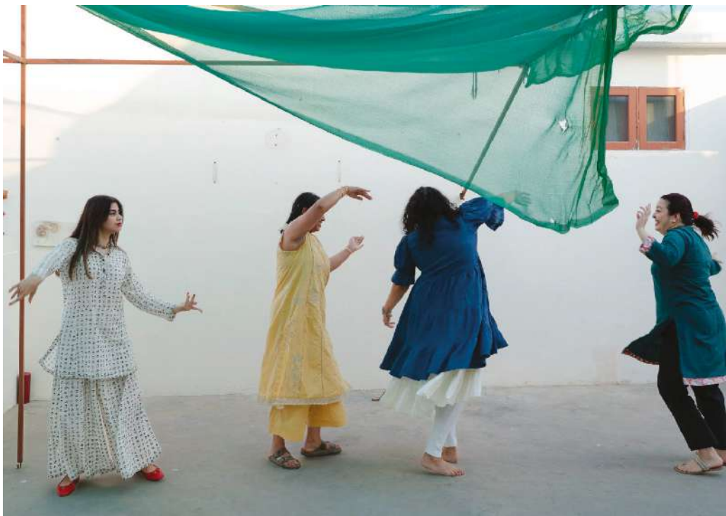
© Giovanni de Mojana & Benedetta Gavazzi, Khatoon , LesAssociés, 2025.