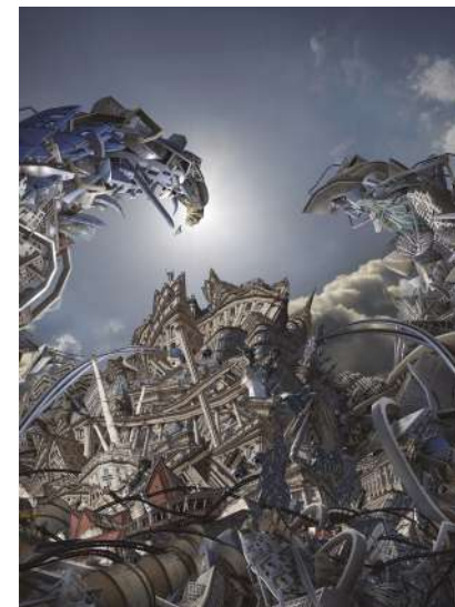
© Thibault Messac, La fin de leur(s) monde(s) .